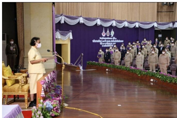
๒) ภาพกิจกรรมของโครงการ (ไม่เกิน ๖ ภาพ)