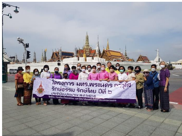
๓) ภาพกิจกรรมของโครงการ (ไม่เกิน ๖ ภาพ)