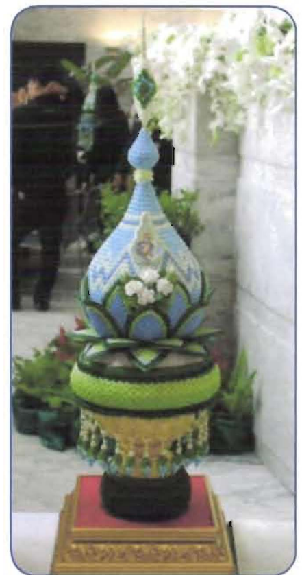
รางวัลดีเด่น