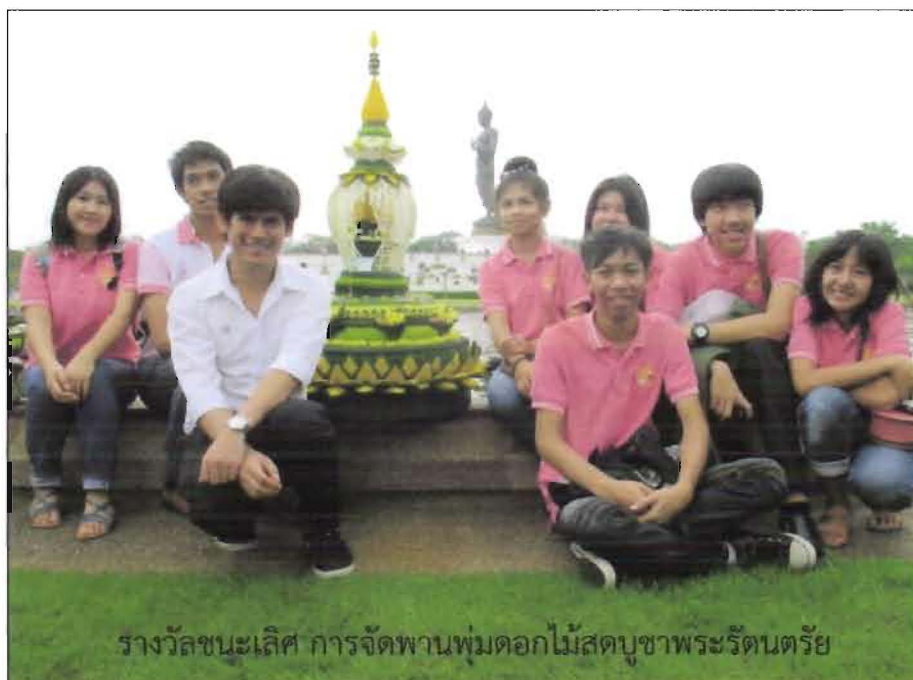
รางวัลชนะเลิศ การจัดทำพานพุ่มดอกไม้สดบูชาพระรัตนตรัย