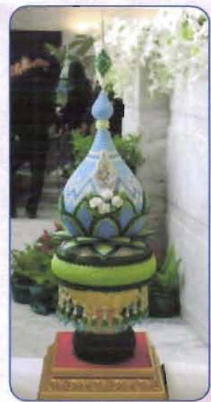
รางวัลขวัญใจกรรมการ