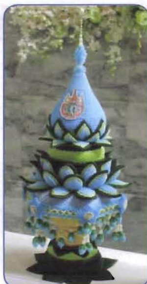
รางวัลส่งเสริมวัฒนธรรมไทย