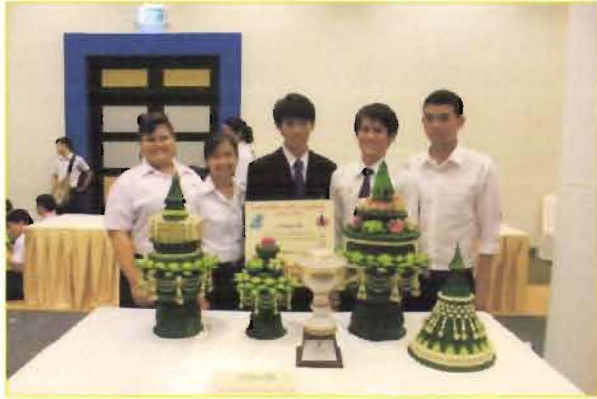
รางวัลชนะเลิศ จากการประกวดเครื่องชั้นหมาก ระดับอุดมศึกษา

นักศึกษาสาขาวิชาการบริหารธุรกิจคหกรรมศาสตร์ คณะเทคโนโลยีคหกรรมศาสตร์ รับรางวัลชนะเลิศ จากการประกวดเครื่องชั้นหมาก ระดับอุดมศึกษาและอีก ๒ รางวัลสำคัญใน โครงการเย็บ ร้อยค้อยจีบ ประดิษฐ์ใบตองระดับชาติ ครั้งที่ ๓ จัดโดย มหาวิทยาลัยราชภัฏ สวนดุสิต เมื่อวันที่ ๑๑ กรกฎาคม ๒๕๕๕ ณ อาคารรักตะกนิษฐ มหาวิทยาลัยราชภัฏสวนดุสิต