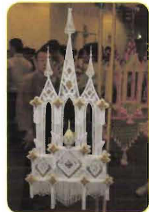
รางวัลรองชนะเลิศอันดับ ๒ การประกวดเครื่องแขวน ประเภทวิมาน ระดับอุดมศึกษา