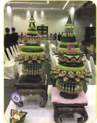
รางวัลรองชนะเลิศอันดับ ๒ การประกวดเครื่องชั้นหมาก ระดับอุดมศึกษา