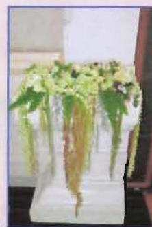
จัดดอกไม้บริเวณเสาทางเดินหน้าหอประชุม