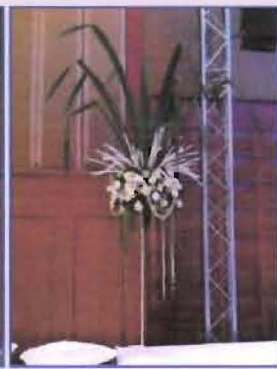
จัดดอกไม้ตกแต่งห้องรับรองพิเศษ