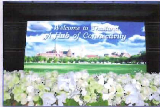
จัดดอกไม้ตกแต่งรอบห้องเจ้าพระยา