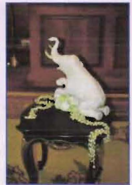
จัดดอกไม้หน้าลิฟท์