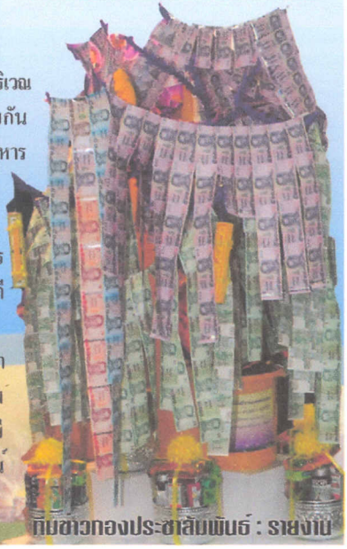
กบฏวาทองประสาธน์ : ราชภัฏ

การถวายผ้าป่าครั้งนี้มีวัตถุประสงค์เพื่อถวายเป็นพระราชกุศลในโอกาสวันเฉลิมพระชนมพรรษา 12 สิงหาคมหาราชินี และสมทบทุนสร้างหลังคากุฏิคณะ 4 วัดอรุณราชวราราม จึงขออาราธนาอานุภาพ แห่งคุณพระศรีรัตนตรัยและสิ่งศักดิ์สิทธิ์ทั้งหลาย โปรดอภิบาล ประทานบุญญาธิการแก่ท่านผู้มี จิตศรัทธาให้ก่อปรกด้วยศุภพรชัยมงคล อาวุธพระคุณ สุขะ พละ ธนสารสมบัติให้พัฒนาสมรรถนะ สมบูรณ์ พูนผล ด้วยลาภ ยศ สรรเสริญ โดยครบถ้วนบริบูรณ์ เทอญ