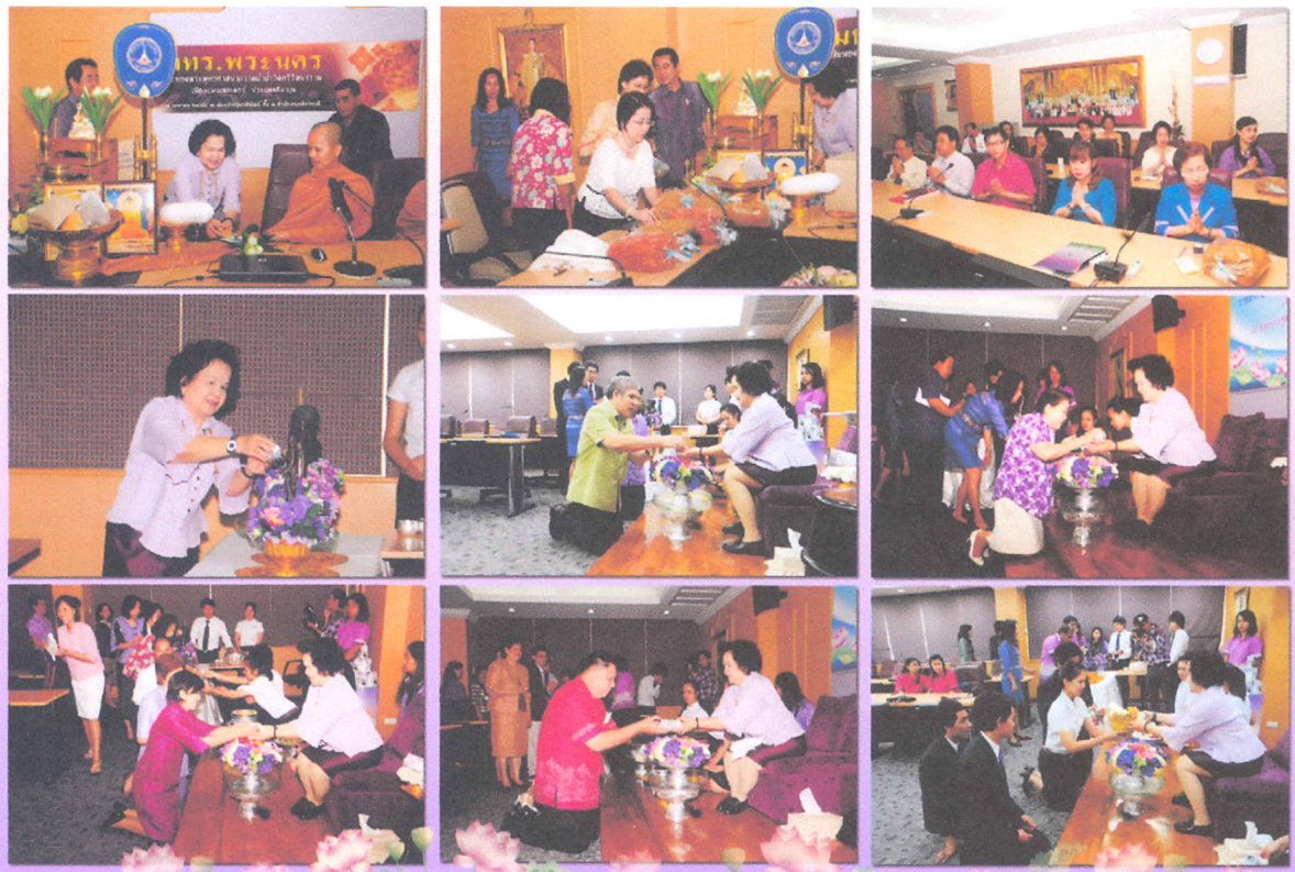
กองประชาสัมพันธ์ มทร.พระนคร : รายงาน

จากนั้นเป็นพิธีรดน้ำขอพรจากท่านอธิการบดีและคณะผู้บริหาร โดยมีวัตถุประสงค์เพื่อสืบสานประเพณีรดน้ำขอพรจากผู้ใหญ่ ซึ่งเป็นพิธีที่ยึดถือปฏิบัติทุกปี โดยมีคณาจารย์ เจ้าหน้าที่ และนักศึกษาทยอยเข้าร่วมพิธีรดน้ำอย่างต่อเนื่อง ที่สำคัญผู้ที่เข้าร่วมงานส่วนใหญ่ต่างแต่งกายด้วยเสื้อผ้าดอกสีสดใส ทำให้บรรยากาศตลอดงานเต็มไปด้วยความอบอุ่น และความประทับใจ