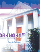
โดย ชัยวัฒน์ หุ่นงาม

พระบาทสมเด็จพระเจ้าอยู่หัวฯ พระบรมราชูปถัมภ์ พระราชทานฉัตรพระเศวต ๖ ชั้น และพระมหาเศวตฉัตร ๘ ชั้น โดยกรมศิลปากร และพระอารามหลวง และวัดนราทนุสฺสทริการาม พระอารามหลวงชั้นโท ชนิดพระอารามหลวงชั้นตรี ชนิดสามัญ ตั้งอยู่เลขที่ ๓๐ ซอยสาม ๒๕๒๖ แขวงบ้านดินนอก เขตปทุมธานี กรุงเทพมหานคร เมื่อวันที่ ๑๐ ตุลาคม ๒๕๒๒ ตรงกับวันขึ้น ๑๒ ค่ำ เดือน ๑๒ สหรัถยัตถะธรรมฉบับนี้จัดพิมพ์ขึ้นเพื่อเป็นเกียรติและเป็นการฉลองพระอารามหลวงที่จัดตั้งขึ้นใหม่หนึ่งร้อยยี่สิบห้าพรรษาครบหนึ่งศตวรรษ และเพื่อเป็นอนุสรณ์ (ฉบับนี้ จัดพิมพ์ครั้งที่ ๒, ๒๕๓๕) อดิศัยจาราวัดนราทนุสฺสทริการาม พลสังฆปริณายก