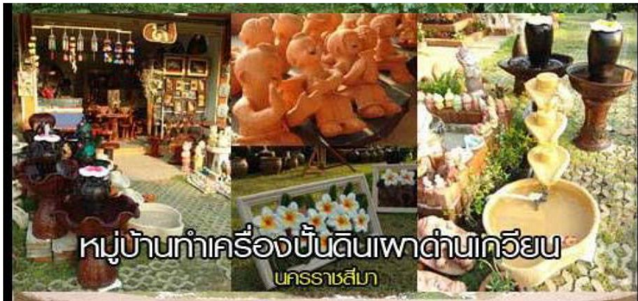
หมู่บ้านทำเครื่องปั้นดินเผาตำบลเกวียน นครราชสีมา