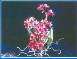
● ดอกเอื้องสายน้ำครั่ง

people in Phra Nakhon Si Ayutthaya province. After attending the training course, the target groups' satisfaction got the highest level because the research product could be extended commercially and academically. In addition, local materials created added value in the research product. Also, the product was differentiated, creative, and elaborated which corresponded to Creative Economy.