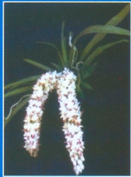
● ช้างไอยยศ

The immeasurable royal wisdom and royal grace of Her Majesty, the Queen, in different areas concerning Silpacheep, forest resource, wild animals and plants have long been widely recognized. Her Majesty the Queen's determination in plant conservation has been perceived and recognized especially on rare wild orchid. We should conserve and pass on the Thai national heritage of orchid for the next generations.